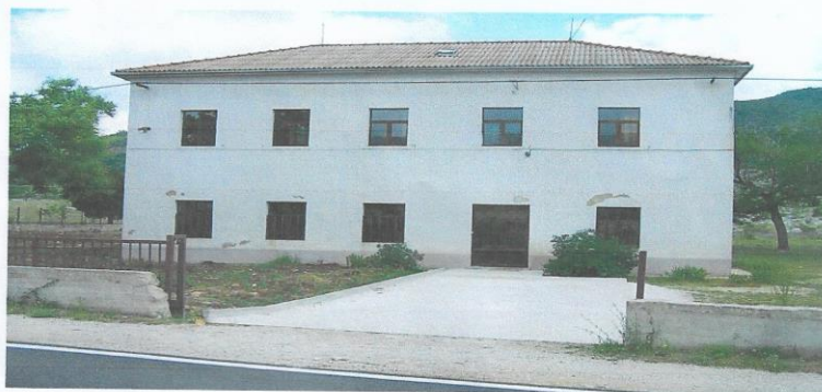
Osnovna škola Petar Kružić

Pored stadiona se nalazi dječji vrtić SV. ANTE i O.Š.PETAR KRUŽIĆ koja se nalazi tu već desetljećima i mnogi stanovnici tog malog sela su pohađali ovu školu i sada oni vode svoje unuke u školu i nadamo se da će se ta tradicija nastaviti dugi niz godina.